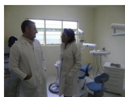
Cadeira de dentista