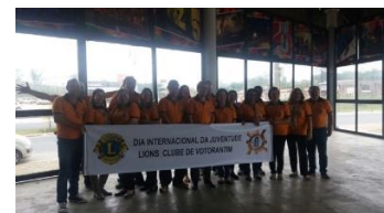
Encontro da juventude