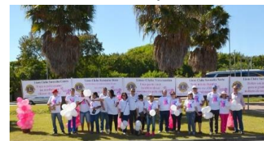
Campanhas de saúde